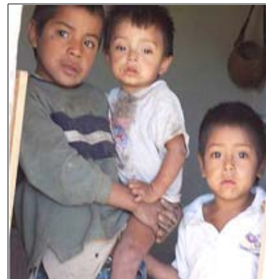
La desnutrición impide el crecimiento de los niños y es muy frecuente en San Lucía y Concepción.

Por si esto no fuera suficiente, en los últimos ocho años, las niñas lograron instalar sus propias tiendas escolares con un capital semilla que anualmente les deja ganancias arriba de los 2,000 lempiras.