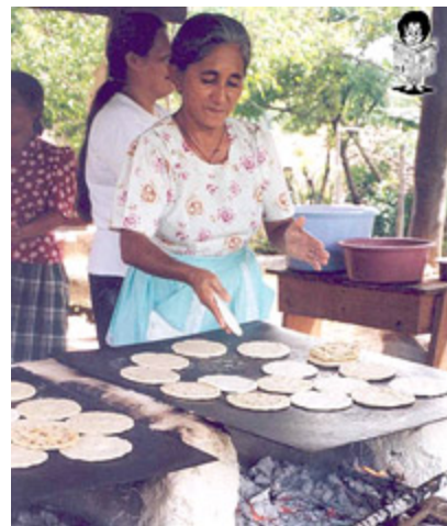
Many poor families have started small business under guidance of volunteers that are part of the altruistic origination

The roads are washed out after winter, which is very heavy in this area. Running water, phone services,