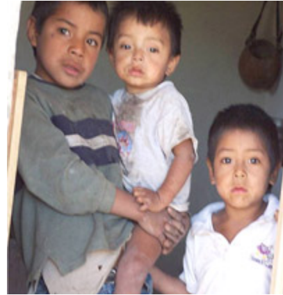
Malnutrition affects children's growth and it is very common in San Lucía and Concepción.