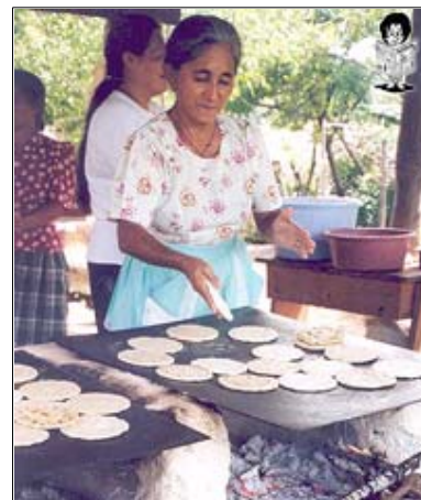
Muchas familias pobres han emprendido pequeños negocios con el asesoramiento de los voluntarios de la organización altruista.

A la lucha de los voluntarios estadounidenses se han unido en el transcurso de los años varios hondureños que se han dado cuenta que sólo “Hombro a Hombro” se puede salir de la pobreza.