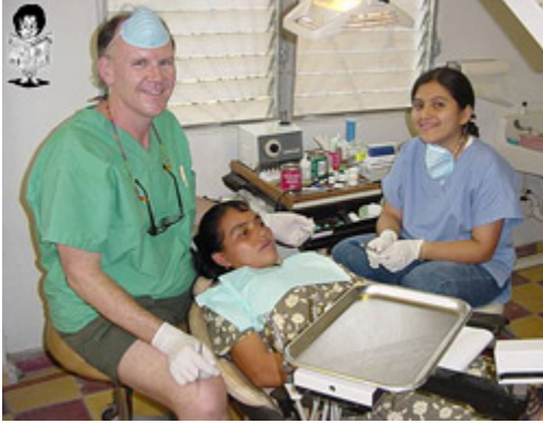
A well-equipped modern Clinic in Santa Lucia. Thousands and thousands of people have received medical attention.